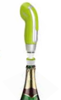
VacSy® vákuumszivattyú üveg dugóval

A beépített, újratölthető lítium ionos akkumulátor lehetővé teszi a vezeték nélküli működtetést (kb. 30 perces folyamatos használat), így a készülék kényelmesen és hatékonyan használható. A kicsi, mégis nagyteljesítményű készülék eltávolítja a levegőt az edényből, így az étel akár 5-ször tovább maradhat friss, mint ha egyszerűen a hűtőszekrényben tároljuk. Vörös fény jelzi a vákuumozási folyamat végét. A kék jelzőfény az akkumulátor töltését jelzi. A készülékhez tartozó állvány helytakarékos kialakítású, így nemcsak a konyhapultra, de akár falra is rögzíthető.