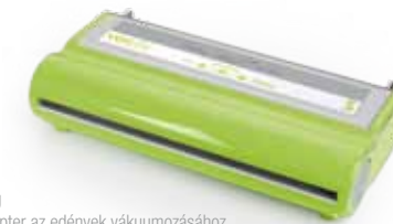
VS-S vákuumfóliázó egység A készlet tartalma: Adapter az edények vákuumozásához, fóliavágó a VacSy® tasakokhoz