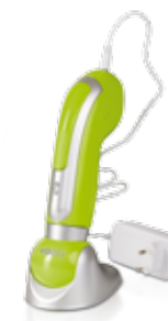
VS-P Vákuumszivattyú A készlet tartalma: Asztali/fali állvány, adapter