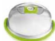
VS-015-28 ø 28 - m: 14 cm Úrtartalom: 4.70 l