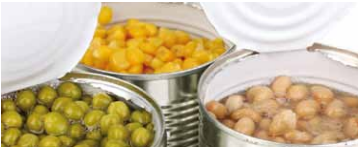
KONZERVKÉNT VALÓ TARTÓSÍTÁS

A fagyasztott zöldségek elfonnyadnak, a hús elszíneződik, minősége romlik, a hal szagát más ételek is átveszik a hűtőben.