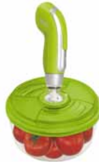
VacSy® vákuumszivattyú tárolóedénnyel

Felhasználóbarát, sokoldalú vákuumcsomagoló rendszer, amely jól kombinálható a VacSy® tárolóedényekkel, a Zepter Masterpiece edényekkel vagy bármely más, kereskedelmi forgalomban kapható edénnyel. A modern vezeték nélküli technológia felhasználásával készült VacSy® vákuumszivattyú hordozható és könnyen kezelhető - HASZNÁLJA BÁRHOL, BÁRMIKOR!