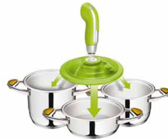
VacSy® vákuumszivattyú lexi fedővel és Zepter edénnyel