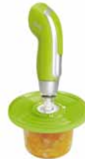
VacSy® vákuumszivattyú univerzális fedővel